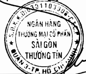
Tổng Giám đốc